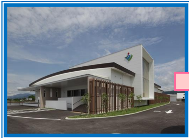
調理場は横武クリーク公園の隣に建っています。

学校で食べる給食は、単なる昼ごはんではなく、栄養バランスのとれた豊かな食事を通して、健康に良い食事のとり方、地域の産業や食文化、食べ物とそれに関わる人への感謝の気持ちなど、さまざまなことを学ぶための教材となるものです。このように重要な役割がある給食は、毎日どのように作られているのでしょうか。調理の様子を紹介します。