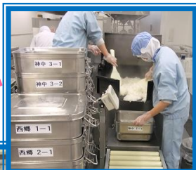
ごはんを炊きます。