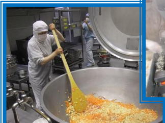
大きな釜で炒めます。