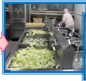
野菜を洗って、機械で切ります。