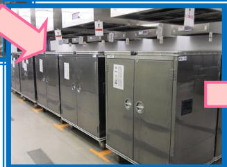
各学校のコンテナに入れます。