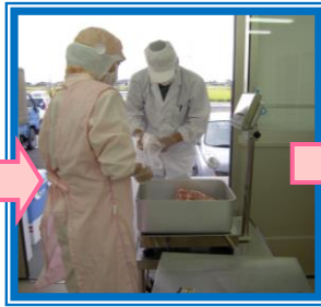
食材を受け取ります。