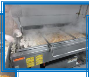
焼き物・揚げ物を作ります。