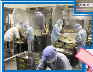
クラスごとに つぎ分けます。