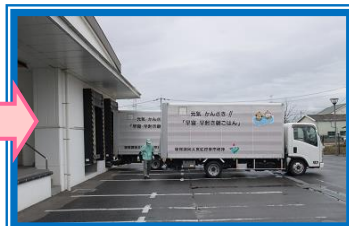
トラックに積んで学校へ出発！